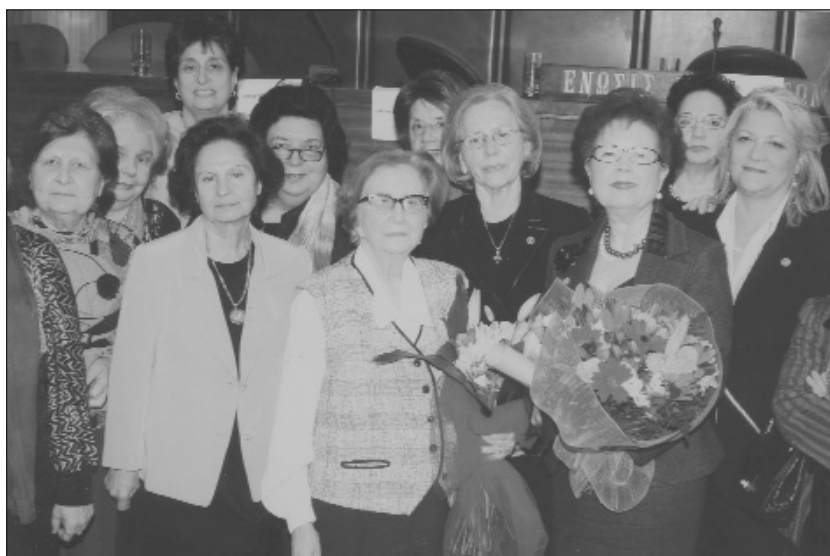
Μέλη των «Φίλων του Νοσοκομείου Αγ. Ανάργυροι» με μέλη του Δ.Σ. του Συνδέσμου για τα Δικαιώματα της Γυναίκας

Εδώ στην Ελλάδα έχουμε ένα μεγάλο κενό, ένα μεγάλο έλλειμμα όσον αφορά τη ρύθμιση, το θεσμικό πλαίσιο που αφορά τον εθελοντισμό και γενικότερα τις ΜΚΟ και την κοινωνία πολιτών. Δεν υπάρχει απλώς. Και αυτό που υπάρχει δυσκολεύει τα πράγματα περισσότερο παρά τα διευκολύνει. Αυτό λοιπόν είναι μια επισήμανση την οποία όλες οι μη κυβερνητικές οργανώσεις θέτουν και επαναθέτουν και συνεχώς βομβαρδίζουν τις εκάστοτε εξουσίες