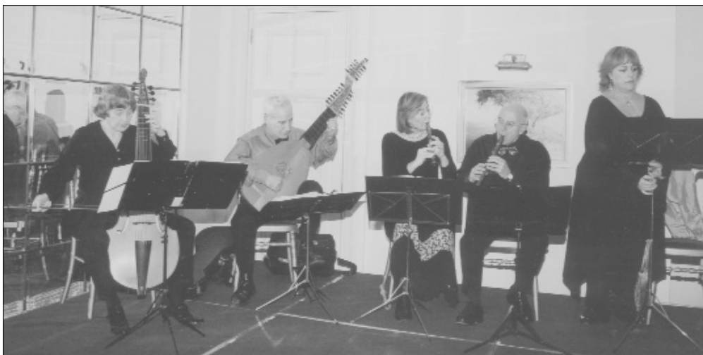
Το Μουσικό σύνολο «ΚΕΛΣΟΣ» εκτελεί το Πρόγραμμά του