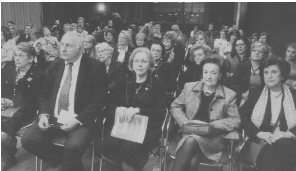
Άποψη του Ακροατηρίου

Πραγματικά είναι πολύ καινοτόμος αυτή η δραστηριότητα που κάνει ο Σύλλογος και πολύ προχωρημένη για την εποχή. Αυτό που σήμερα φαίνεται απλό, για την εποχή του ήταν πολύ προχωρημένο, και χαίρομαι που εξακολουθεί να είναι κοντά μας και να μας στηρίζει. Ευχαριστούμε πάρα πολύ που μας βοηθάτε και εύχομαι να είστε πάντα κοντά μας.