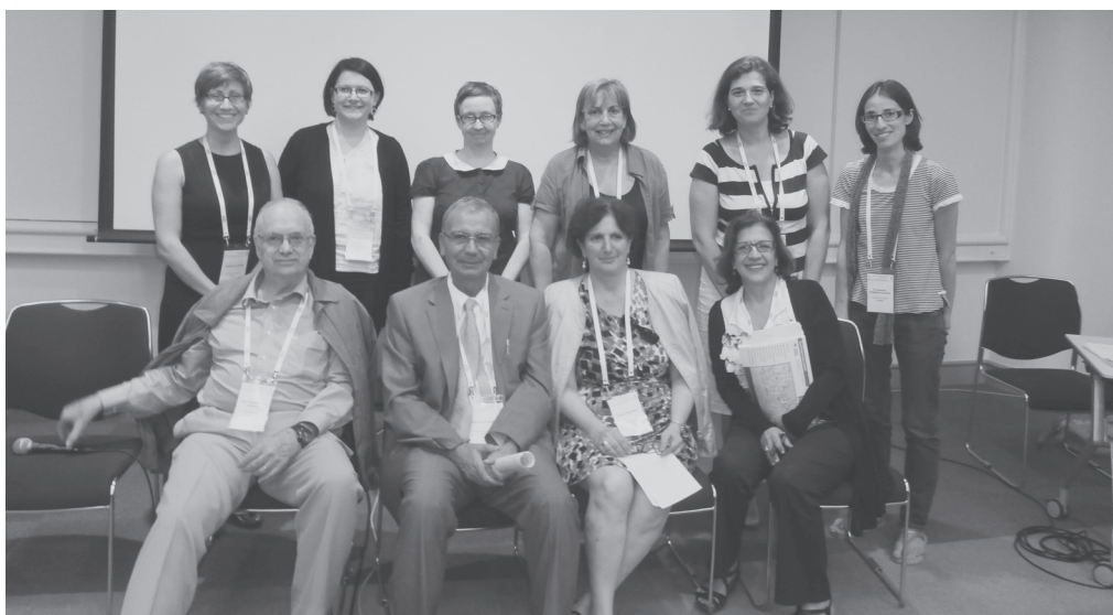
Απο την συνεδρία «Γυναίκες και Οικονομική Κρίση: Νέες προκλήσεις και μορφές έμφυλων ανισοτήτων» με τους εισηγητές και τις εισηγήτριες.