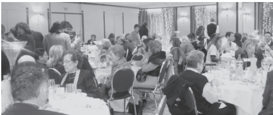
Φίλες και φίλοι του Συνδέσμου στην εκδήλωση

Σας ευχαριστώ όλους και όλες, και σας εύχομαι και πάλι καλή και ευτυχημένη χρονιά.