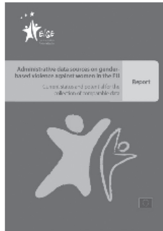
Administrative data sources on gender-based violence against women in the EU: Report