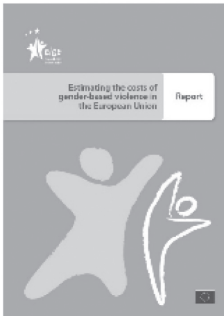
Estimating the costs of gender-based violence in the European Union

Όπως βλέπουμε, το EIGE προσφέρει μια σφαιρική και ολοκληρωμένη σειρά συγκριτικών μελετών που καλύπτουν πολλές πτυχές του φαινομένου της βίας κατά των γυναικών. Η προσφορά του ωστόσο δεν περιορίζεται μόνο στις μελέτες που εκπονεί αλλά και στο «Κέντρο Τεκμηρίωσης/Resource and Documentation Centre (RDC) που διαθέτει στην οποία έχουν καταχωρηθεί πλούσια βιβλιογραφία και στατιστικά δεδομένα για την έμφυλη βία σε ευρωπαϊκό επίπεδο και η οποία αποτελεί την πρώτη βάση δεδομένων στον τομέα αυτό και μπορεί κάθε ενδιαφερόμενος να αναζητήσει σχετικά δεδομένα στην ιστοσελίδα του EIGE ( http://eige.europa.eu/content/rdc ).