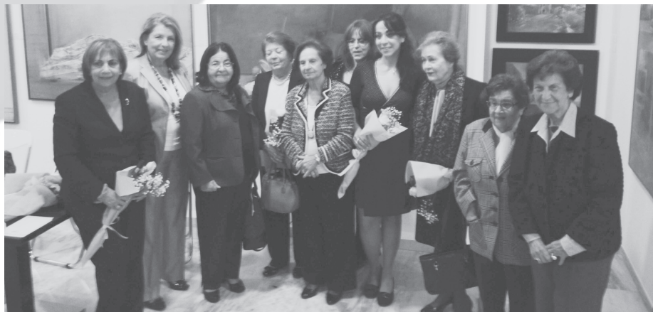
Τα μέλη του Δ.Σ. του Συνδέσμου με τις ομιλήτριες